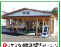
8 さかき地場産直売所「あいさい」