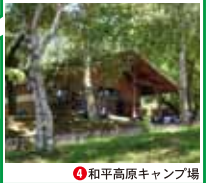
1 和乎高原キャンプ場

和乎高原施設 お問い合わせ・お申込み ☎0268-82-0284 都市公園管理センター