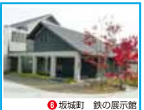
6 坂城町 鉄の展示館