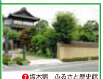
7 坂木宿 ふるさと歴史館