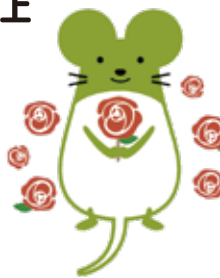
坂城町マスコットキャラクター「ねずこん」

ばら祭り会場 さかき千曲川バラ公園 長野県埴科郡坂城町大字中之条2800 (お問い合わせは下記へ)